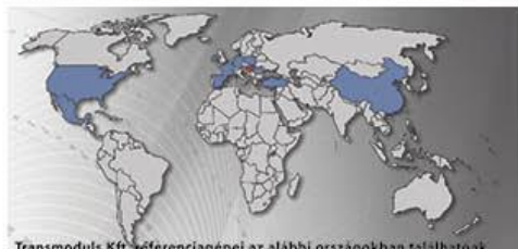
Transmoduls Kft. referenciagépei az alábbi országokban találhatóak

A veszprémi székhelyű TRANSMODULS Kft. szállító-pálya-rendszerek tervezésével és gyártásával kezdte tevékenységét, majd teljes értékű rendszerintegrátorra és szerelő-automaták gyártójává fejlődött főleg az autói-, élelmiszer- és az elektronika ipar szegmenseiben. Növekedését elsősorban az innovatív és újító megoldásainak és a megnövekedett vevői követelményeknek köszönheti a magyar, román, szlovák, lengyel és kínai piacon.